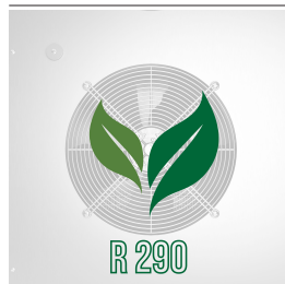
Umweltfreundliches Gas (R290)