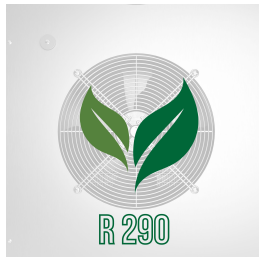
Umweltfreundliches Gas (R290)