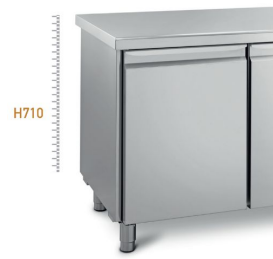
Körperhöhe 710 mm