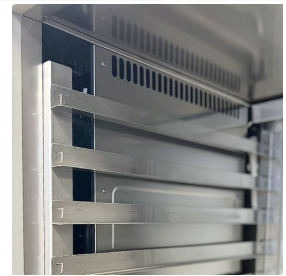
Automatische Verdunstung des Kondenswassers