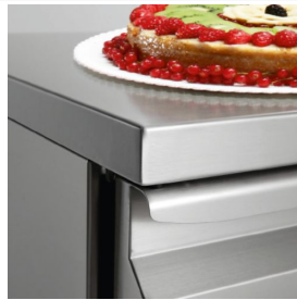
Arbeitsplatten aus Edelstahl, 40 mm hoch, verstärkt und aus 15/10 starkem Blech gefertigt