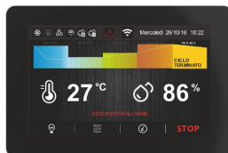
5" TOUCH Benutzeroberfläche