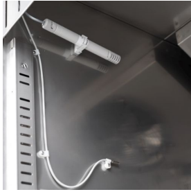
Feuchtigkeitskontrolle mit elektronischer Sonde