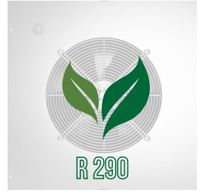
Umweltfreundliches Gas (R290)