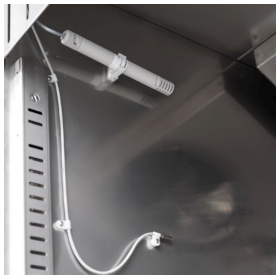
Feuchtigkeitskontrolle mit elektronischer Sonde