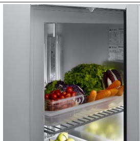
Innenkapazität GN 2/1