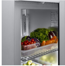
Innenkapazität GN 2/1