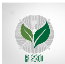
Umweltfreundliches Gas (R290)