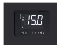
Digitaler Touch- Thermostat