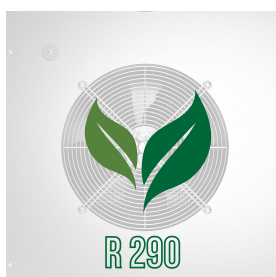
Umweltfreundliches Gas (R290)