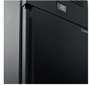
Individuelle Farbgestaltung auf Anfrage erhältlich