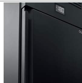
Individuelle Farbgestaltung auf Anfrage erhältlich