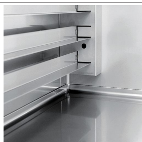
Racks with easily removable runners with 74 positions (16.5 mm pitch)