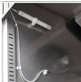
Humidity control with electronic probe