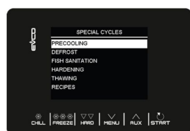
Besondere voreingestellte Zyklen