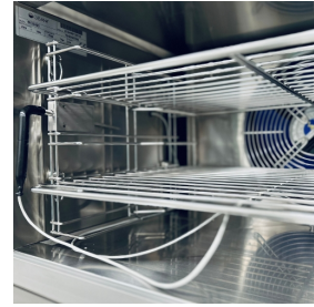
Details zur internen Belüftung