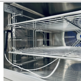
Details zur internen Belüftung