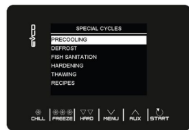
Besondere voreingestellte Zyklen