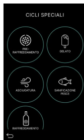
Bildschirm für spezielle Zyklen