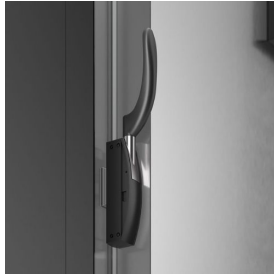
Widerstandsfähiger Griff aus AISI 304 Edelstahl