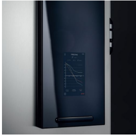
Detail des Bedienpanels mit getempertem Rauchglas