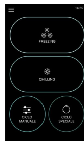
Startbildschirm elektronische Platine Touchscreen 7"