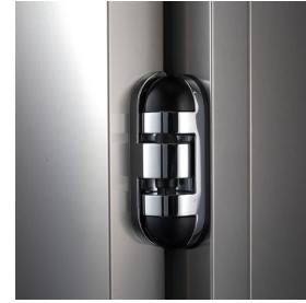
Detail des Scharniers für Anschlagtür