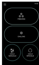
Startbildschirm elektronische Platine Touchscreen 7"