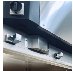
Dictator für Soft- Closing und automatische Türschließung (auf Anfrage)