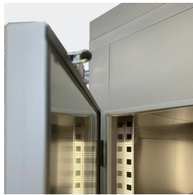
Details zur Türdicke