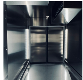
LED-Beleuchtung, gleichmäßig und effizient