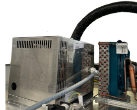
Hocheffizienter Dampfkessel (Dampferzeugung von 2-2,6 kg/h)