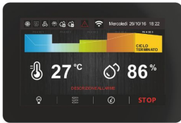
7" TOUCH Benutzeroberfläche