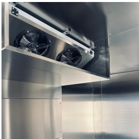
Elektronische Ventilatoren, die die Belüftung in jeder Phase optimieren