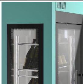
Individuelle Farboberfläche (auf Anfrage)