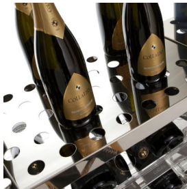
SR5/01 Gelochtes Regal aus Edelstahl, Kapazität: 32 Flaschen