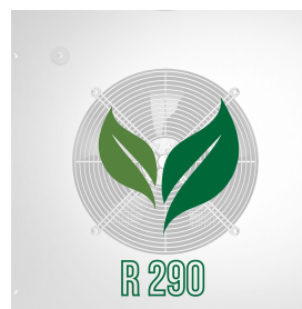
Umweltfreundliches Gas (R290)