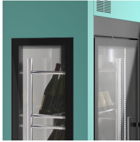
Individuelle Farboberfläche (auf Anfrage)