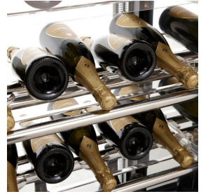
SC5/03 Plexiglas - Auflagenboden