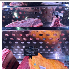
Lochboden aus Edelstahl