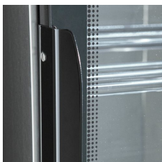
Farboberfläche (auf Anfrage)