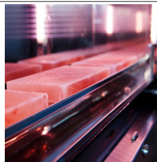
Set mit 3 Platten aus rosa Himalaya-Salz