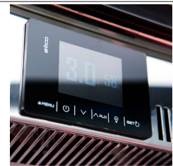
Digitales Touch-Display mit Feuchtigkeitsregelung