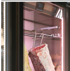
Kernfühler und Aufhängevorrichtungen aus Edelstahl