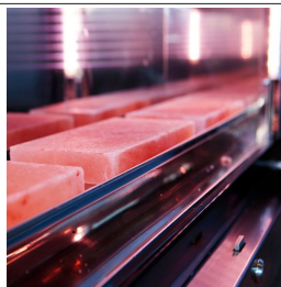
Set mit 3 Platten aus rosa Himalaya-Salz