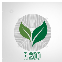
Umweltfreundliches Gas (R290)