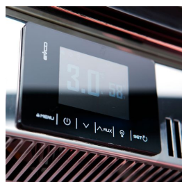
Digitales Touch-Display mit Feuchtigkeitsregelung