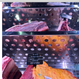
Lochboden aus Edelstahl