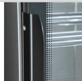
Farboberfläche (auf Anfrage)