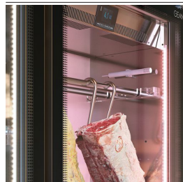
Kernfühler und Aufhängevorrichtungen aus Edelstahl