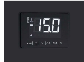
Thermostat tactile numérique