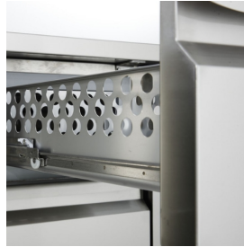
Détail du caisson à tiroirs.