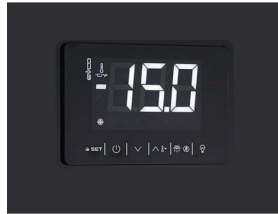
Thermostat tactile numérique