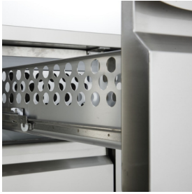
Détail du caisson à tiroirs.