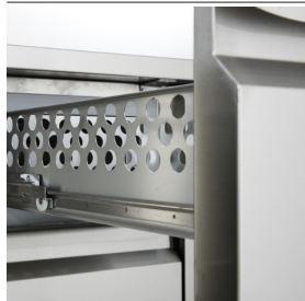
Détail du caisson à tiroirs.