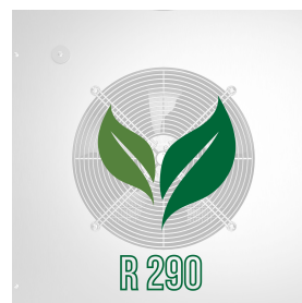
Gaz écologique (R290)