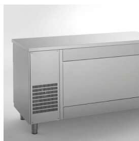
Finition dos en acier inox