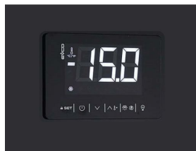
Thermostat tactile numérique