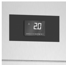
Surveillance constante de la température avec carte de contrôle numérique