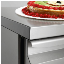
Plans de travail en acier inoxydable h 40 mm renforcés et réalisés en tôle épaisseur 15/10.