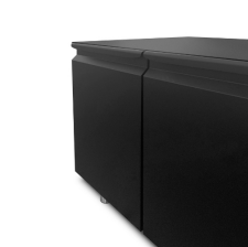
Finition couleur (RAL) sur demande