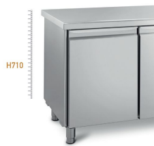
corps h710 mm