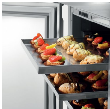
plateaux 40x60 cm