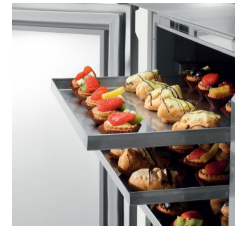
plateaux 40x60 cm