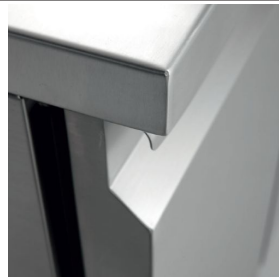
Les plans de travail en acier inoxydable h 40 mm sont renforcés et fabriqués avec une tôle de 15/10