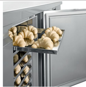
Plateau en acier inoxydable 40x60 cm