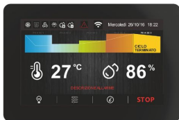
Carte électronique TACTILE de 5"