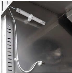
Contrôle de l'humidité avec une sonde électronique