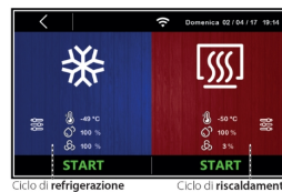
Cycle de travail manuel