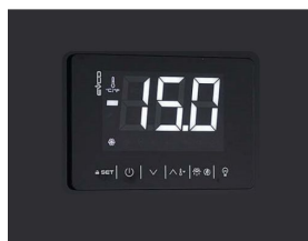
Thermostat tactile numérique