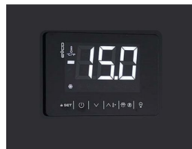
Thermostat tactile numérique