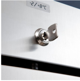
Serrure à clé