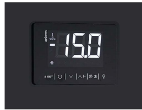
Thermostat tactile numérique