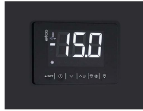
Thermostat tactile numérique