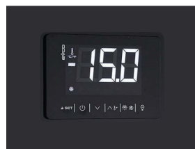
Thermostat tactile numérique