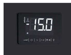
Thermostat tactile numérique