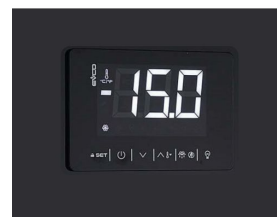
Thermostat tactile numérique