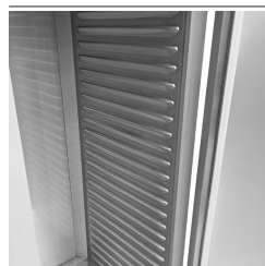
Détail des intérieurs emboutis en acier inoxydable