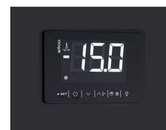
Thermostat tactile numérique