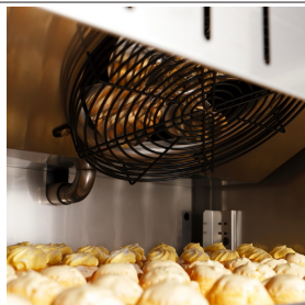
Évaporateurs avec traitement par cataphorèse et ventilateurs électroniques