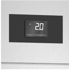
Surveillance constante de la température avec carte de contrôle numérique