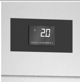
Surveillance constante de la température avec carte de contrôle numérique