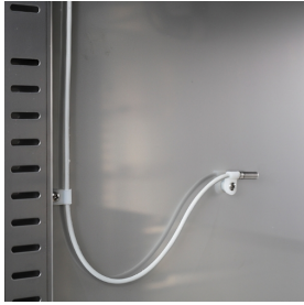
Sonde interne de cellule pour le contrôle constant de la température