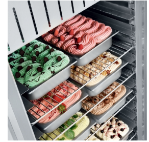
Capacité intérieure totale de 54 bacs à glace de 5 litres chacun