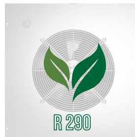
Gaz écologique (R290)