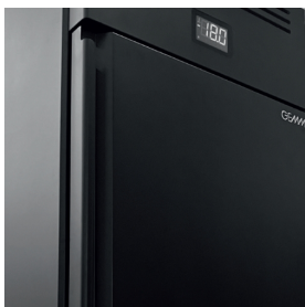
Finition couleur personnalisée disponible sur demande