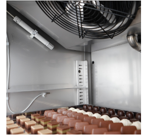
Sonde électronique pour la détection de l'humidité relative