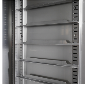
Crémaillères avec glissières facilement amovibles, 74 positions (pas de 16,5 mm)