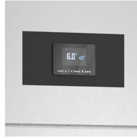
Elektronische Steuerplatine zur konstanten Regelung von Temperatur und relativer Luftfeuchtigkeit