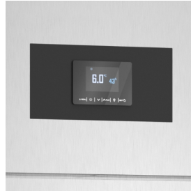
Elektronische Steuerplatine zur konstanten Regelung von Temperatur und relativer Luftfeuchtigkeit