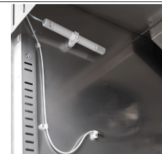
Contrôle de l'humidité avec une sonde électronique