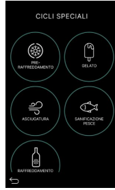
Écran des cycles spéciaux