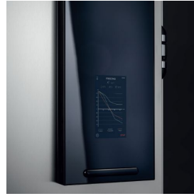
Détail du panneau de commande avec verre trempé fumé