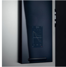
Détail du panneau de commande avec verre trempé fumé