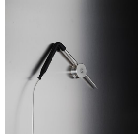
Sonde à aiguille