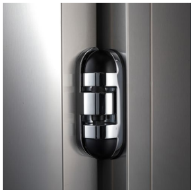
Détail de la charnière de porte battante