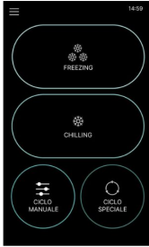
Écran initial carte électronique écran tactile 7"