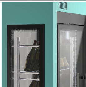
Finition couleur personnalisée (sur demande)