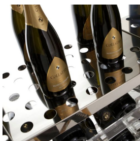
SR5/01 Étagère perforée en acier inoxydable, capacité : 32 bouteilles