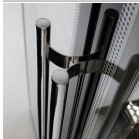
Détail de la poignée de porte en acier inoxydable