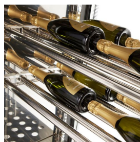
ST5/02 Structure à tuyaux inox