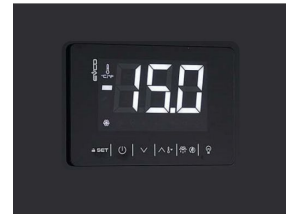
Termostato digital touch