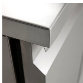
Costruzione in acciaio inox con spessore isolamento di 50mm