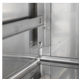
Particolare interno cella