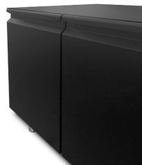
Finitura colore (RAL) su richiesta