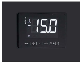
Termostato digital touch