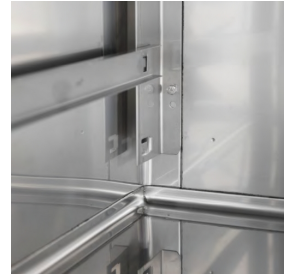
Particolare interno cella