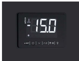
Termostato digital touch