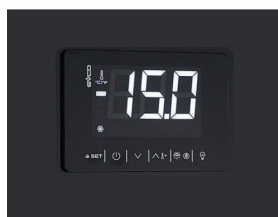
Termostato digital touch