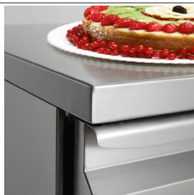
Piani di lavoro in acciaio inox h 40 mm rinforzati e realizzati con lamiera spessore 15/10