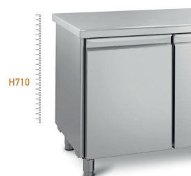
corpo h710 mm