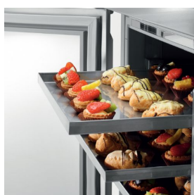
teglie 40x60 cm