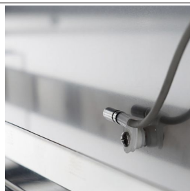
Sonda interno cella per il controllo costante della temperatura