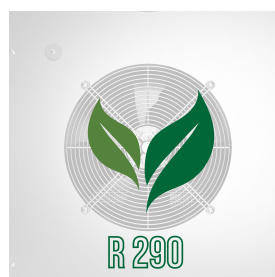
Gas ecologico (R290)