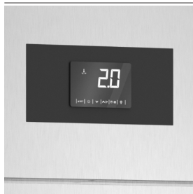
Monitoraggio costante della temperatura con scheda di controllo digitale