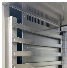
Evaporazione automatica dell'acqua di condensa