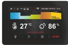
Scheda elettronica TOUCH da 5" facile ed intuitiva.