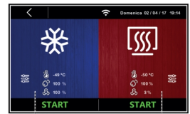
Ciclo di lavoro manuale