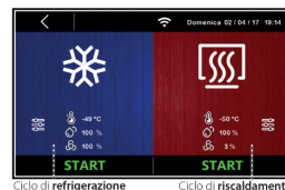
Ciclo di lavoro manuale