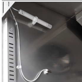
Controllo dell'umidità con sonda elettronica