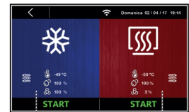
Ciclo di lavoro manuale