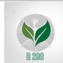
Gas ecologico (R290)