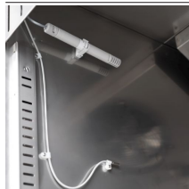
Controllo dell'umidità con sonda elettronica