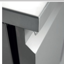
Piani di lavoro in acciaio inox h 40 mm rinforzati e realizzati con lamiera spessore 15/10