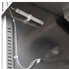
Controllo dell'umidità con sonda elettronica