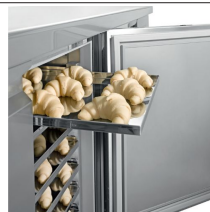
Teglia inox cm 40x60