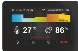
Scheda elettronica TOUCH da 5" facile ed intuitiva.