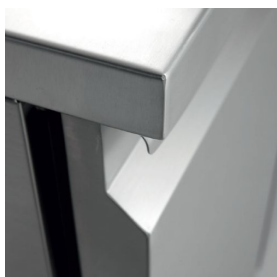
Piani di lavoro in acciaio inox h 40 mm rinforzati e realizzati con lamiera spessore 15/10