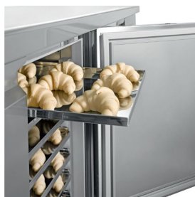
Teglia inox cm 40x60