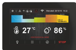
Scheda elettronica TOUCH da 5" facile ed intuitiva.