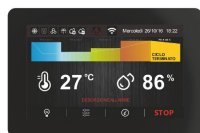
Scheda elettronica TOUCH da 5" facile ed intuitiva.