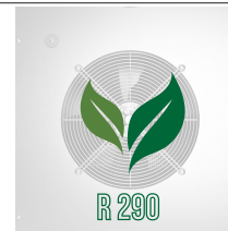
Gas ecologico (R290)