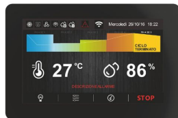
Scheda elettronica TOUCH da 5" facile ed intuitiva.