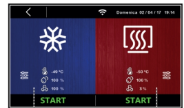
Ciclo di lavoro manuale