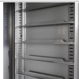
Passo 65mm, 19 posizioni