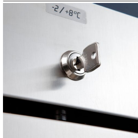
Serratura a chiave