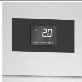
Monitoraggio costante della temperatura con scheda di controllo digitale