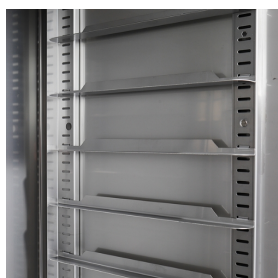
Cremagliere con guide facilmente rimovibili con 74 posizioni (passo mm 16,5)