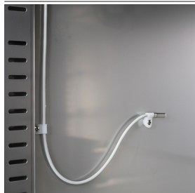
Sonda interno cella per il controllo costante della temperatura