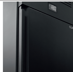
Su richiesta personalizzazione finitura colore