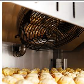
Evaporatori con trattamento in cataforesi e ventilatori elettronici